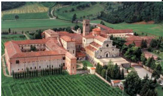
Abbazia di Praglia

ore 19.30 Trasferimento a Rovolon per la cena tipica veneta all'osteria "Vecio Veneto"