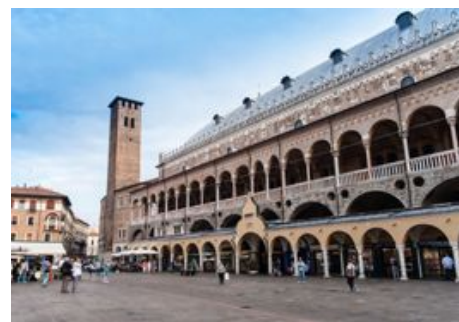
Palazzo della Ragione