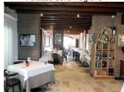
Ristorante "La Tavolozza"